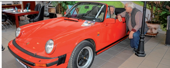
Jensens Büro ist auch ein Showroom der Männerträume, zum Beispiel dieser rote Porsche 911 Carrera Cabrio.

Doch die Firma Jensen Classics findet man erst nach