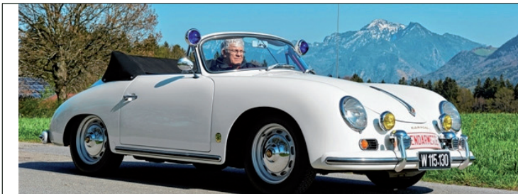
Ein spezieller Sammlerwunsch war der Porsche 356 Gendarmenwagen aus Österreich, Baujahr 1958. Alles ist original, nur das Funkgerät eine Attrappe.